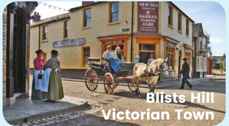
Blists Hill Victorian Town