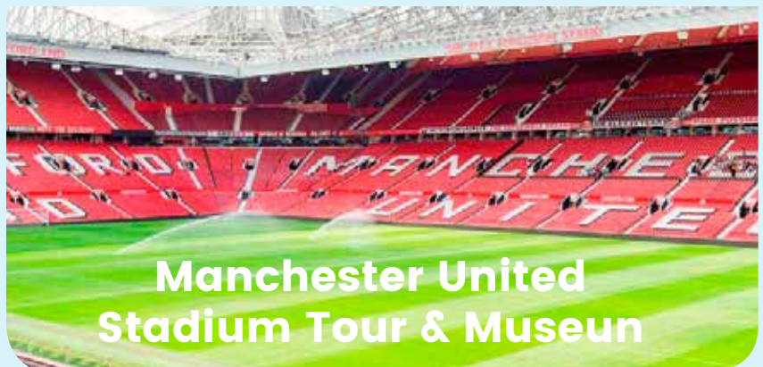
Manchester United Stadium Tour & Museum