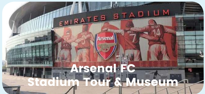
Arsenal FC Stadium Tour & Museum